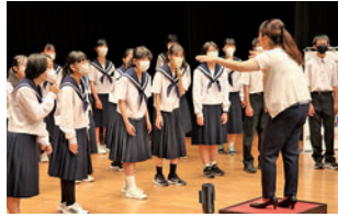
阿久比中学校合唱部