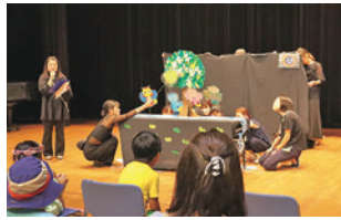
すずらん絵本読み聞かせ