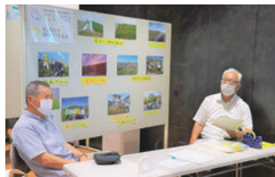
矢勝川の環境を守る会