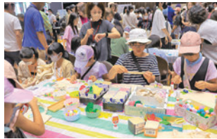
オリジナルエコバック作り