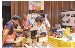
陽なたの丘自主防災会