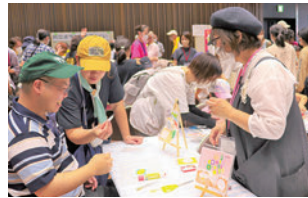
メッセージカード作り