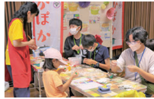
子ども食堂ほかほか