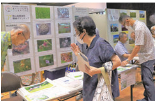
板山高根湿地環境ボランティア