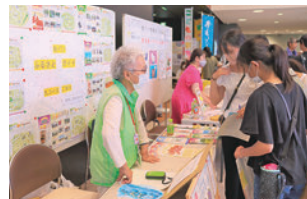
あぐいふるさとガイド