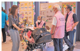
阿久比町民生委員児童委員協議会