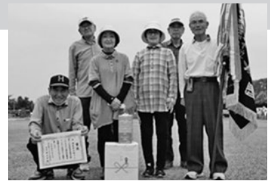
優勝／宮津団地達者会