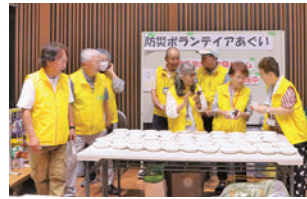
防災ボランティアあぐい