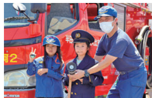
こども消防士制服体験