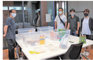
デンソー緑ジョイライフ活動隊 フードドライブ