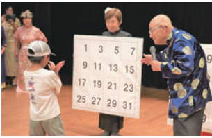
ハッピーマジック