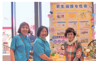
阿久比町更生保護女性会