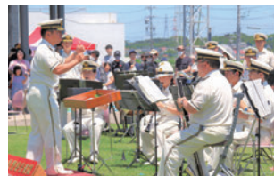
愛知県警察音楽隊