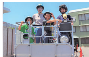
はしご車試乗体験