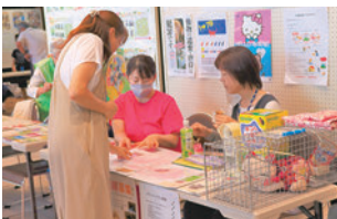
あぐい地域ねこの会