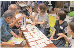
手話サークル花かつみ &もちっこ手話体験