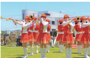
愛知県警察音楽隊