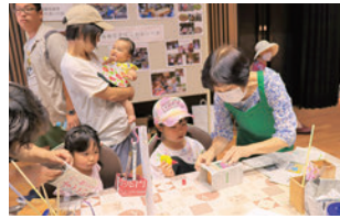
南部宅老所ふれあいの会