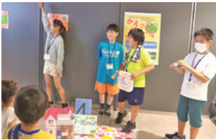
子育て支援グループむぎ・むぎ こどものまち、かえっこバザール