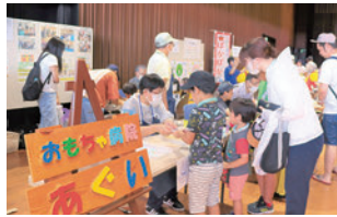
おもちゃ病院あぐい